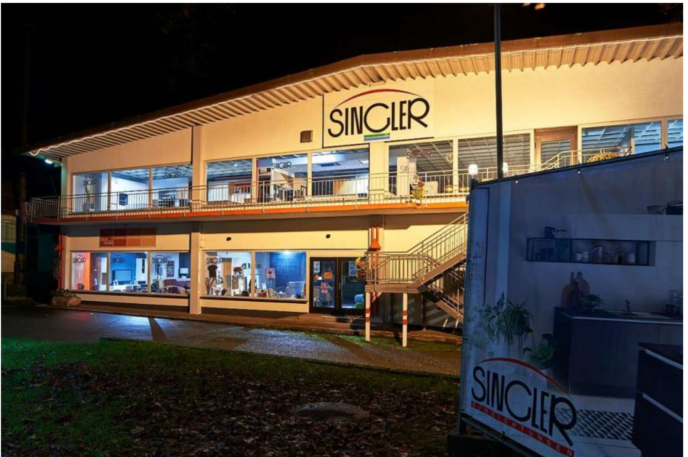
Das Möbelhaus Singler in der Geroldsecker Vorstadt schließt 2023. Auf dem Gelände sind Wohnungen geplant.

BZ-Plus | Das Möbelhaus Singler in der Geroldsecker Vorstadt in Lahr schließt nächstes Jahr. Die Deutsche Bauwert übernimmt das Areal und plant 90 Wohnungen. Auch eine soziale Einrichtung soll dort unterkommen.